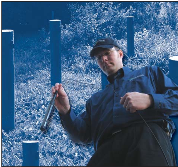
Divers suspendidos en los pozos para monitoreo continuo