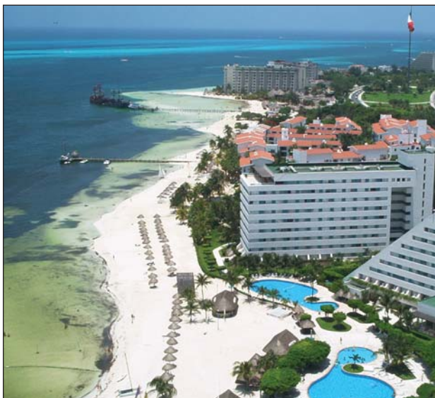
La zona turística de estudio abarca 50 Km. y se extiende a lo ancho hasta 16 Km.

Akumal y Boca Paila, Quintana Roo, Mexico